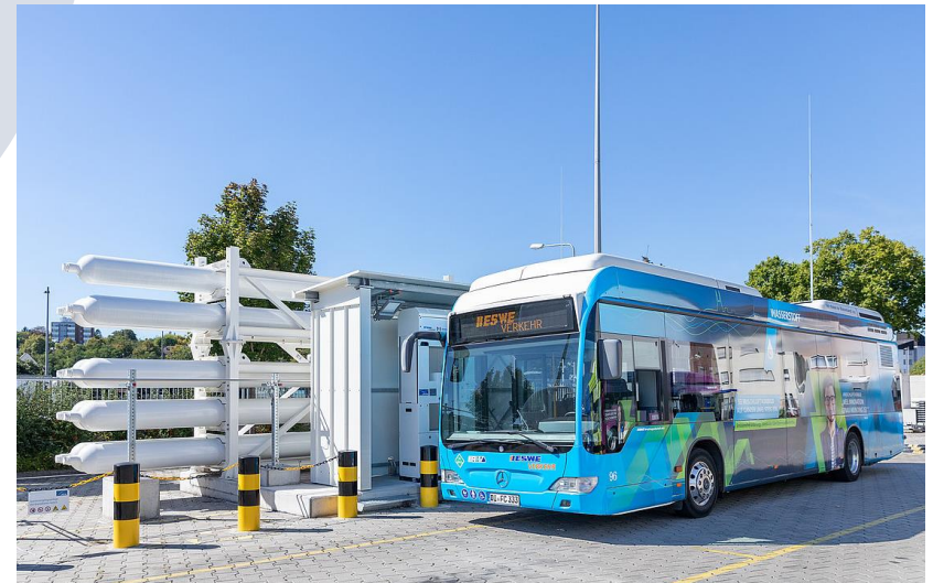
Abb. 6: Wasserstoffbus Wiesbaden