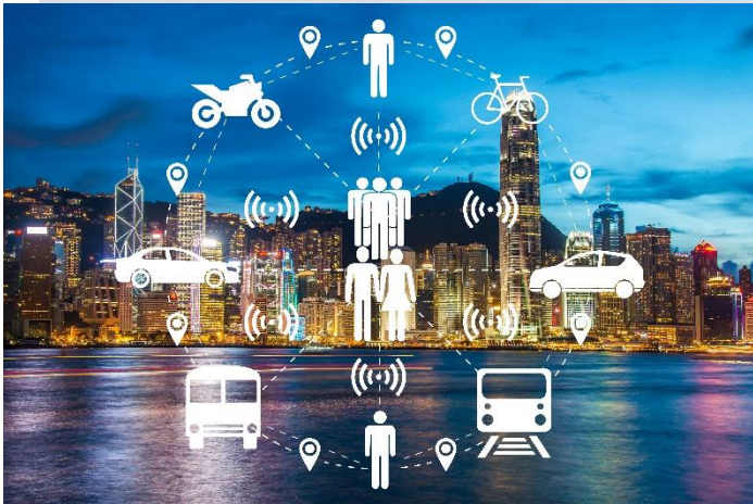
Abb. 1: Vernetzte Mobilität