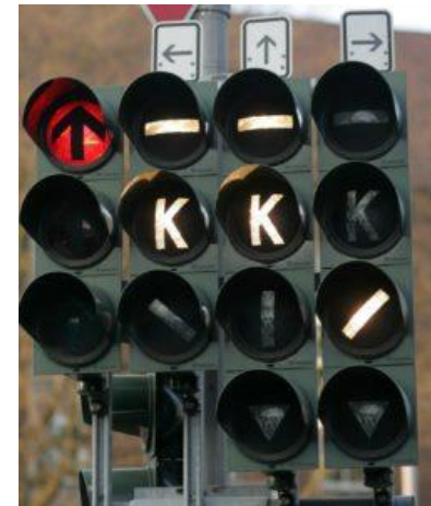
Abb. 2: Busampel