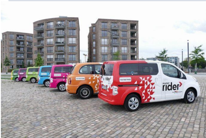
Abb. 3: Fahrzeuge MainzRIDER