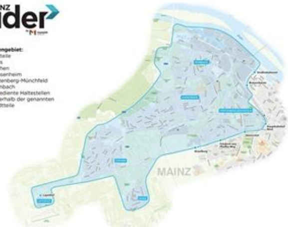
Abb. 4: Bediengebiet MainzRIDER