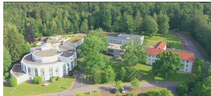
Europäische Akademie Otzenhausen